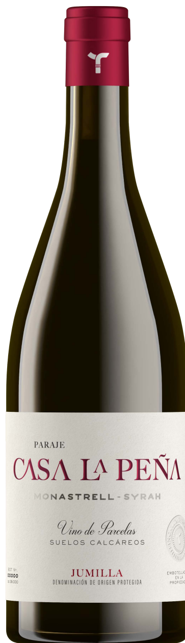
JUMILLA DENOMINACIÓN DE ORIGEN PROTEGIDA